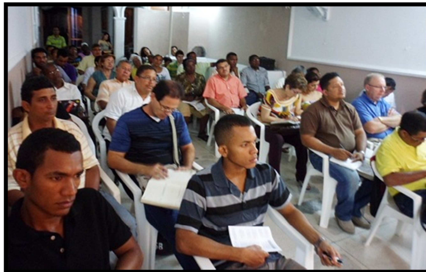
Asistentes a la conferencia Doctrina de Dios de Gospel Through Colombia.