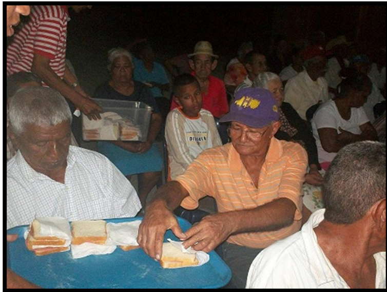
Hermanos de las Américas compartiendo una merienda.

La obra que Dios nos ha llamado a hacer tiene muchas responsabilidades, desde el punto de vista misionero, desde la diaconía, desde la koinonía, desde la enseñanza y preparación de líderes todo con el propósito de establecer una iglesia fiel a la Palabra de Dios y a la teología reformada. Por esto les pedimos el favor estar en oración por las siguientes peticiones: