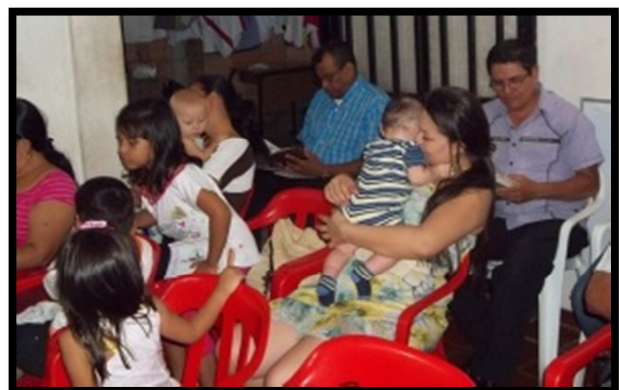
A la izquierda hermanos de Cúcuta y a la derecha hermanos de Arauca.