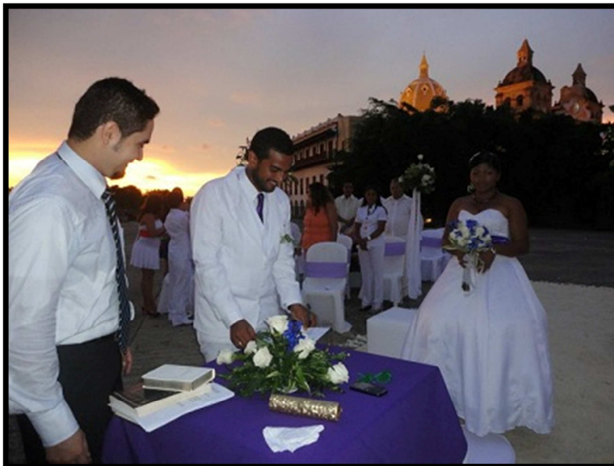
Un bello y romántico atardecer Cartagenero