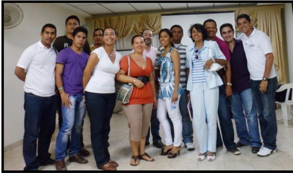
Estudiantes del programa Gospel de Sincelejo.